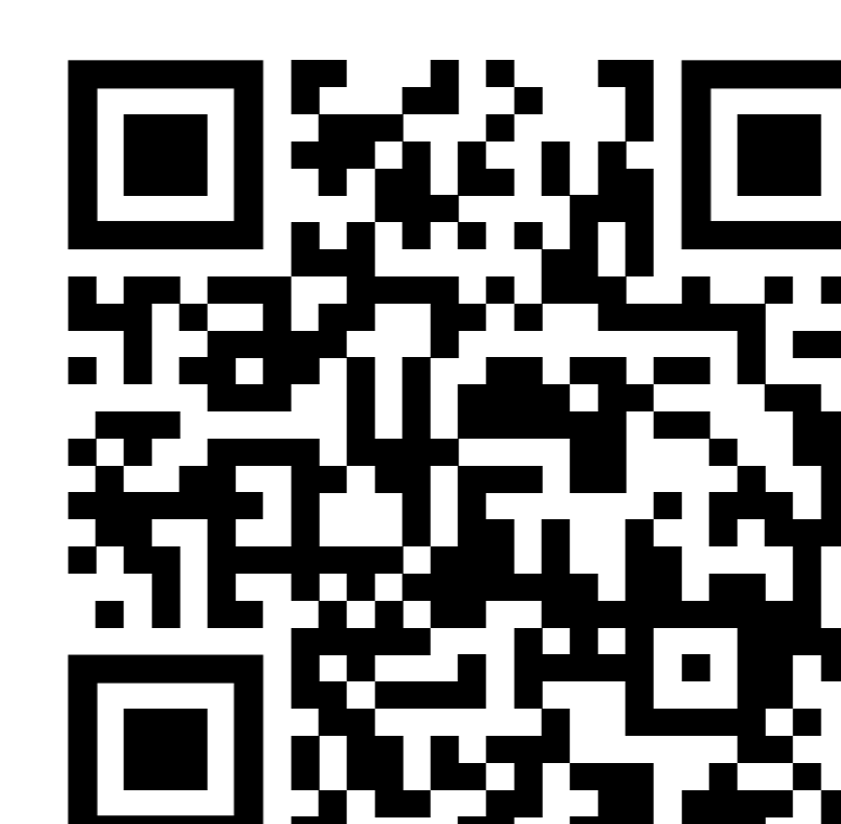
Фото блюд и доставка